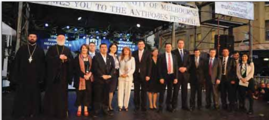
Άνω αριστερά άποψη της οδού Λόνσντεϊλ στο «Γλέντι» του 1988 και δεξιά το ίδιο σημείο στο «Γλέντι» του 2011 - αναμφισβήτητη απόδειξη της τεράστιας απήκησης που έχει τόσο στην παροικία μας όσο και στην ευρύτερη αυστραλιανή κοινωνία το «Γλέντι». Κάτω αριστερά οι πρώην πρωθυπουργοί Μπορ Χοκ και Τζον Κέιν (Βικτόρια) ενώ προσέρχονται στο «Γλέντι» και δεξιά οι επίσημοι, στην κεντρική εξέδρα, στο «Γλέντι» του 2011. Στην αριστερή σελίδα, κάτω, προγράμματα προηγούμενων ετών του Φεστιβάλ «Αντίποδες»

συναυλία στην κεντρική εξέδρα, αναμφίβολα θα προσελκύσει πάνω από 100.000 άτομα στον ελληνικό δρόμο της Μελβούρνης.»