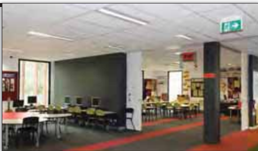
Άποψη των νέων αιθουσών διδασκαλίας του Alphington Grammar

Η οικονομική βοήθεια θα παρέχεται ύστερα από αίτηση των ενδιαφερομένων και για ένα μόνο