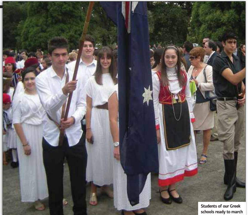
Students of our Greek schools ready to march