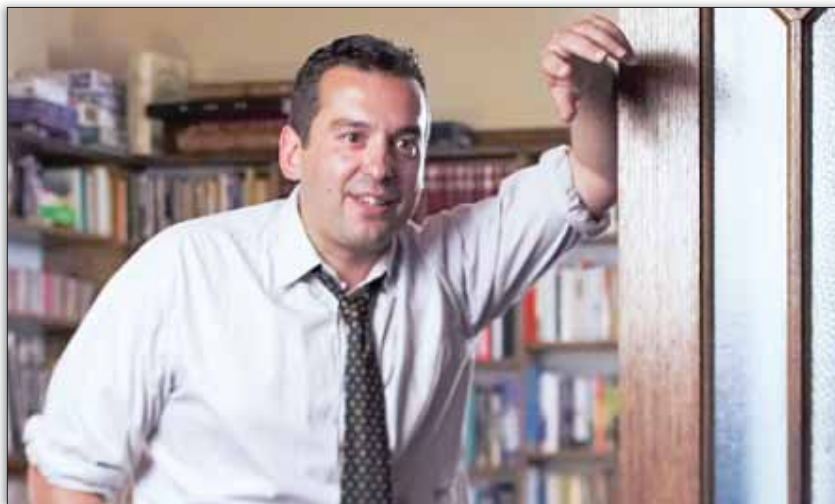
Ο Χρήστος Τσιόλκας

Το Φεστιβάλ θα αρχίσει την Παρασκευή το βράδυ, με τον πολυβραβευμένο Ελληνοαυστραλό συγγραφέα Χρήστο Τσιόλκα (έργα του είναι και τα: The Slap, Loaded, Dead Europe ) και με τον καθηγητή