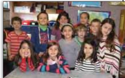
Μαθητές και μαθήτριες των απογευματινών σχολείων μας

νικό Πολιτισμό, την Ελληνική Μυθολογία, τους Πελοποννησιακούς Πολέμους, τον Μέγα Αλέξανδρο και άλλα γλωσσικά βιβλία που θα εμπλουτίσουν πάρα πολύ τους μαθητές μας από πλευράς γνώσεων και χρήσης της ελληνικής γλώσσας.» τονίζει. «Επίσης, φέτος, ανακοινώσαμε τη δημιουργία τάξεων Ελληνικών για αρχάριους μαθητές ηλικίας μεταξύ 10-15 ετών.»