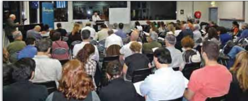
Πολλά άτομα παρακολούθησαν τα Σεμινάρια Ελληνικής Ιστορίας και Πολιτισμού το 2011

Αρχίζει στις 8 Μαρτίου η νέα σειρά των Σεμιναρίων Ελληνικής Ιστορίας και Πολιτισμού, μετά τη μεγάλη επιτυχία που είχαν το 2011, όπου περισσότερα από 150 άτομα εκδήλωσαν ενδιαφέρον να τα παρακολουθήσουν.