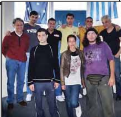
Νεοφερμένοι κατά την επίσκεψή τους στα γραφεία της Κοινότητας