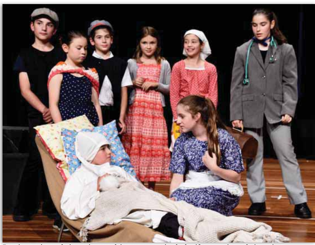
Στιγμιότυπα από τις σχολικές γιορτές των σχολείων μας με τις οποίες ολοκληρώθηκε μια ακόμα σχολική χρονιά

παρουσίασαν θεατρικά την περίοδο από τη λήξη του Β' Παγκοσμίου Πολέμου μέχρι και το 1967 και την πτώση της χούντας.