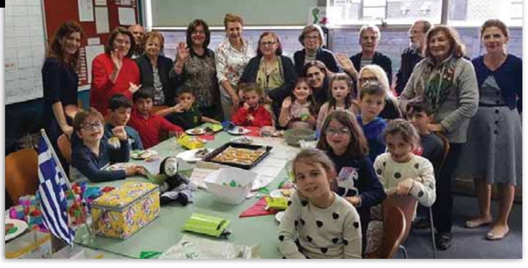
Στιγμότυπα από τις δημιουργικές δραστηριότητες των μαθητών μας

Χαίρομαι πολύ που τώρα έχουμε την ευκαιρία να ξανασυναντηθούμε με τη φίλη μου