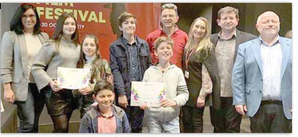
Στιγμιότυπο από την απονομή των βραβείων σε μαθητές των σχολείων της Κοινότητας

Α. Δημοτικό σχολείο 1ο Βραβείο: Oakleigh Grammar, Ένας θποαυρός από το παρελθόν 2ο Βραβείο: Oakleigh Grammar, Μια περιπέτεια στο