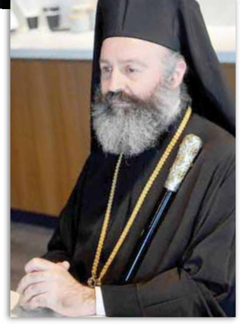
Ο Αρχιεπίσκοπος κκ. Μακάριος