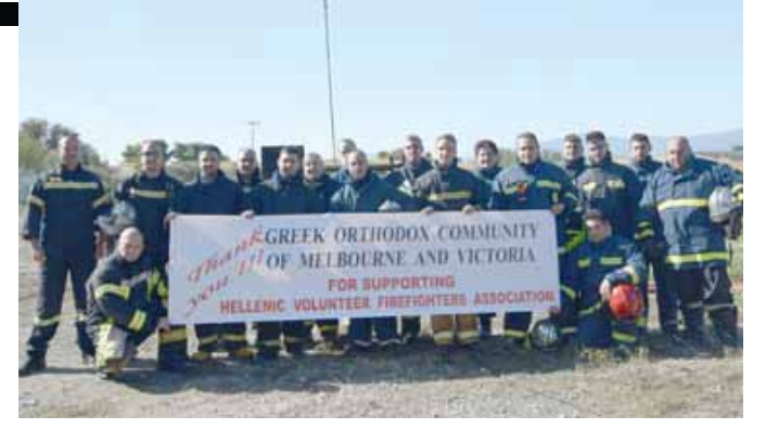
Φωτογραφίες με τους εθελοντές πυροσβέστες στην πρόσφατη άσκηση που έκαναν, ενώ κρατούν πανό με το οποίο ευχαριστούν την Κοινότητα για τη στήριξή της

«Το πρόγραμμα περιλάμβανε τεχνικές πυρόσβεσης για πυρκαγιές καυσίμων και ένα μέρος του κόστους καλύφθηκε από τη δωρεά σας,» αναφέρεται στην επιστολή. «Για άλλη μια φορά θα θέλαμε να σας ευχαριστήσουμε για την υποστήριξή σας προς τους εθελοντές πυροσβέστες.»