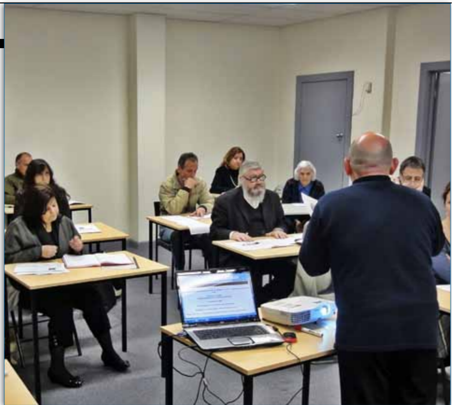
Στημιότυπο από την τάξη Αρχαίων Ελληνικών για ενήλικες

Το πρόγραμμα αυτό περιλαμβάνει για την ώρα 4 κύκλους σπουδών διάρκειας 10 εβδομάδων. Ο πρώτος κύκλος σπουδών απευθύνεται σε απολύτως αρχάριους σπουδαστές που έρχονται για πρώτη φορά σε επαφή με την ελληνική γλώσσα. Στους επόμενους τρεις κύκλους, που αποτελούν συνέχεια του πρώτου και μεταξύ τους, οι σπουδαστές εισάγονται στα θεμελιώδη γραμματικά και συντακτικά φαινόμενα της