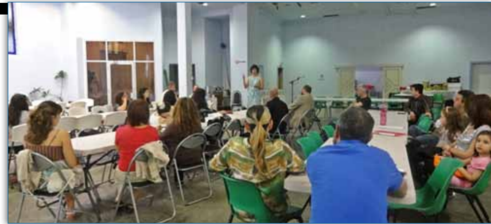
An open meeting with interested parents was conducted early December

For a start, the level of Greek of these students compared to other local students in the same age group is well advanced. Even if you put them up a few grades, this doesn't solve the problem as it raises issues of age-differ-