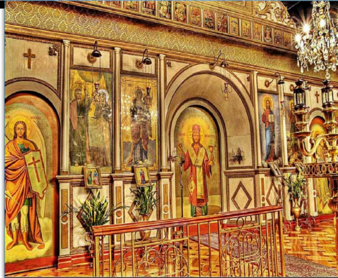
The Foundation stone of the Evangelismos church was laid on 19 December 1900

The Greek born population of Victoria at that time was appr. 200 and that of Melbourne, probably less than 150, most of them bachelors. There was no response from the Patriarchate in 1895. In 1897, Dorotheos Bakaliaros, an Archimandrite, visited Melbourne and