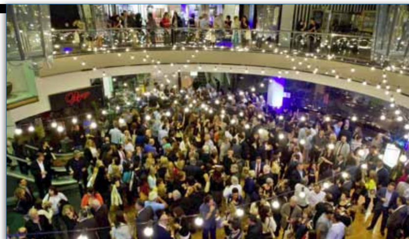
Στημιότυπο από τα εγκαίνια του Φεστιβάλ Κινηματογράφου