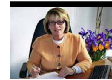
By Dr. VIVIANNE NIKOU

Our Prep to Year 2 concert with the theme "Across the Universe" provided the most uplifting and emotionally charged respite in what is one of the busiest periods of time in the academic calendar.