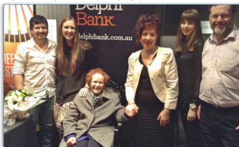
Η σκηνοθέτης Νάταλι Κάνιγγχαμ με την οικογένειά της