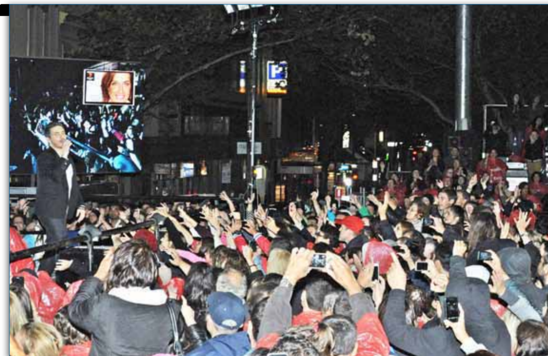
Ο Μιχάλης Χατζηγιάννης στη συναυλία που έδωσε πέρυσι στο Φεστιβάλ της Λόντεϊλ

Ο Μιχάλης Χατζηγιάννης γεννήθηκε στη Λευκωσία της Κύπρου και αποφοίτησε από τη Μουσική Ακαδημία του Λονδίνου (Royal