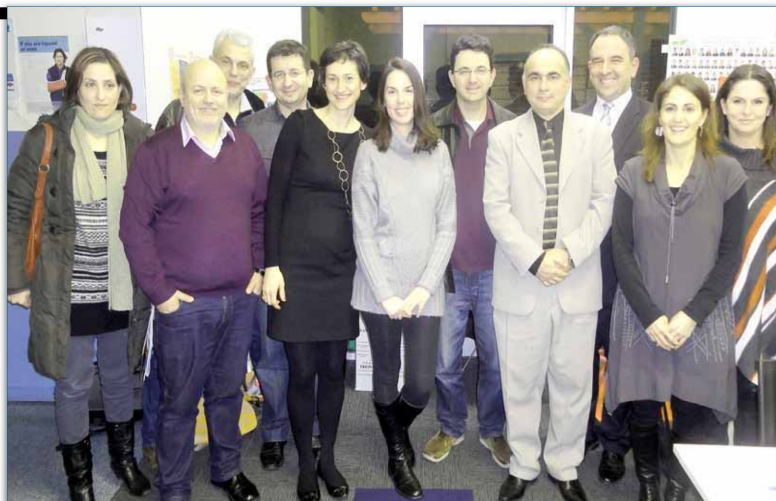
Συγγράμματα από πρόσφατα ενημερωτική συνάντηση γονέων, εκπαιδευτικών και μελών του Διοικητικού Συμβουλίου της Κοινότητας σε πρόσφατη ενημερωτική συνάντηση στο σχολείο του Μάλβερν

ον, το σχολείο μας αυτό αποτελεί κατά κάποιο τρόπο ένα μέσο σύνδεσης με το πρότερο σχολικό και μαθησιακό περιβάλλον της Ελλάδας και ομαλής μετάβασης και προσαρμογής στη νέα πραγματικότητα.»