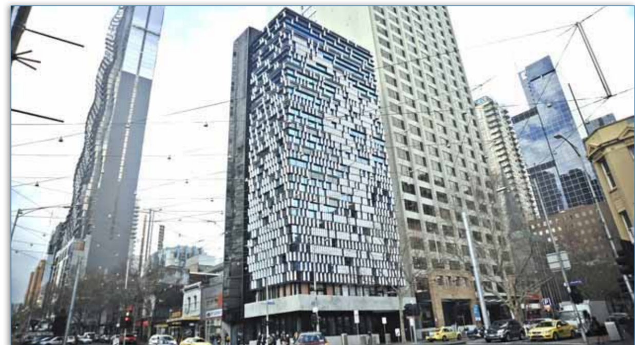
Ανω, το «διαμάντι της ελληνικής παροικίας»... και δεξιά μια «γνωριμία» με τους εσωτερικούς χώρους του

το νέο κτίριο. Παράλληλα, η διαρρύθμιση του Ελληνικού Κέντρου Σύγχρονου Πολιτισμού έχει αρχίσει και αναμένεται να ολοκληρωθεί μέσα στους επόμενους μήνες, οπότε θα αρχίσει να χρησιμοποιείται τόσο από την Κοινότητα όσο και από άλλους οργανισμούς για ειδικές πολιτιστικές εκδηλώσεις.