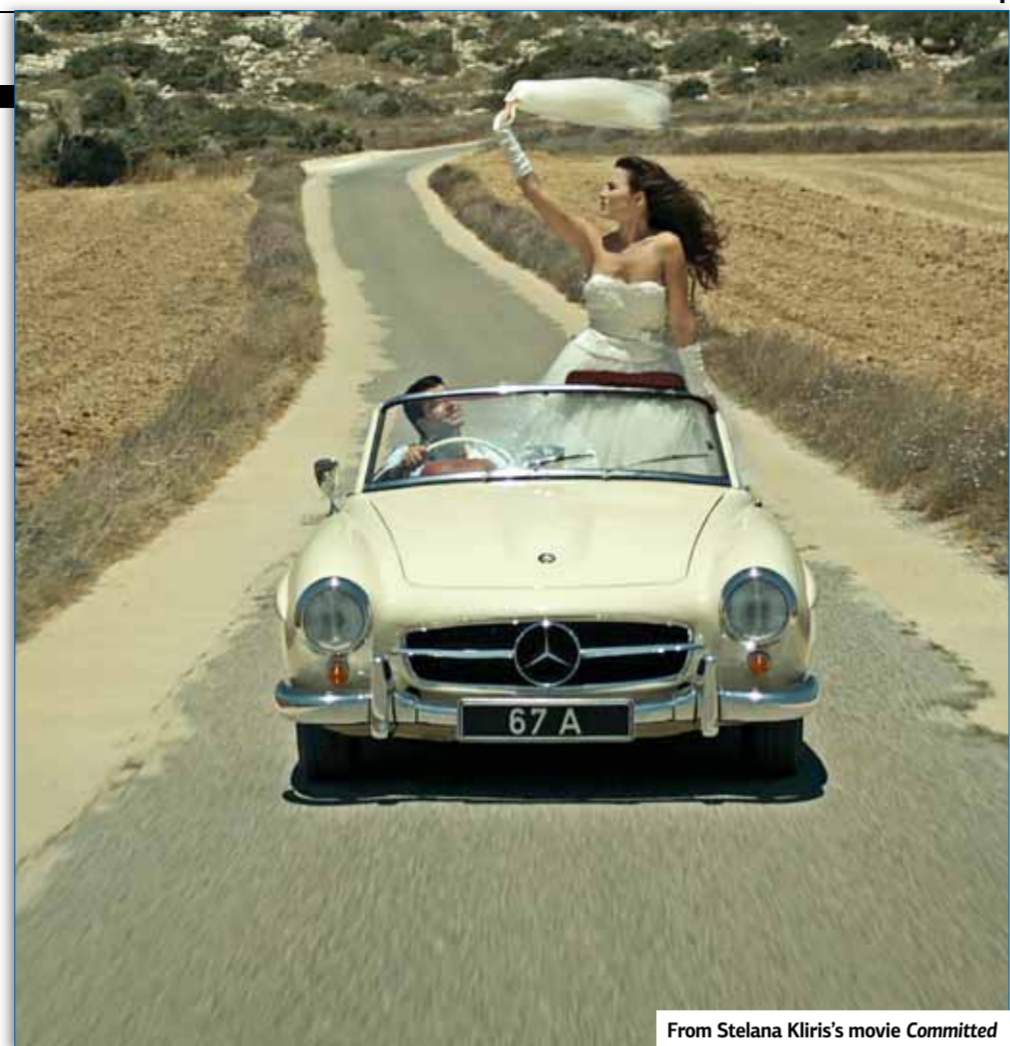
From Stelana Kliris's movie Committed

The Delphi Bank Greek Film Festival turns 21 this year, returning with an outstanding program of contemporary Greek cinema.