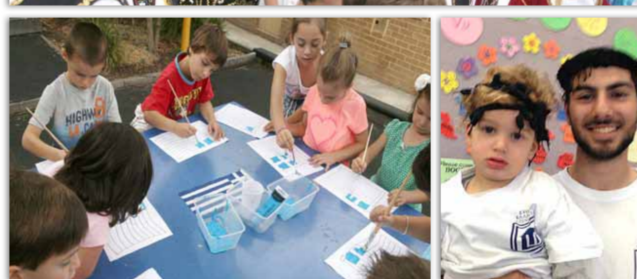
Στις φωτο, από άνω: Εκπαιδευτικοί των σχολείων μας ενώ παρακολουθούν ειδικό επιμορφωτικό Σεμινάριο που διοργάνωσε η Κοινότητα, αξιωματικοί των Ελληνικών Ενόπλων Δυνάμεων επισκέφθηκαν το σχολείο μας στο Ντοκαστέρ, τμήμα του προγράμματος διδασκαλίας Νέων Ελληνικών για ενήλικες, μαθητές μας στην παρέλαση της 25ης Μαρτίου, μικροί μαθητές ζωγραφίζουν την ελληνική σημαία και δύο μαθητές των σχολείων μας... από την μικρότερη και μεγαλύτερη τάξη.

η στενότερη συνεργασία όλων των μελών της σχολικής κοινότητας. «Στόχος είναι τα προγράμματα και οι δραστηριότητες αυτές να ανταποκριθούν καλύτερα στα ιδιαίτερα