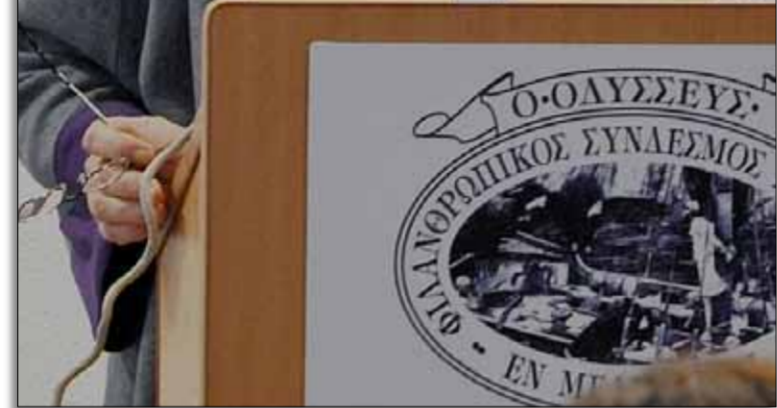
Η καθηγήτρια Αθηνά Ζώνιου-Σιδέρη

Όπως είπε, οι δανειστές επέβαλαν μια σκληρή δημοσιονομική πολιτική που έμελε να πλήξει θεμελιακά κοινωνικά, πολιτικά και εργασιακά δικαιώματα και να αλλάξουν ριζικά το κοινωνικοπολιτικό χάρτη της χώρας.