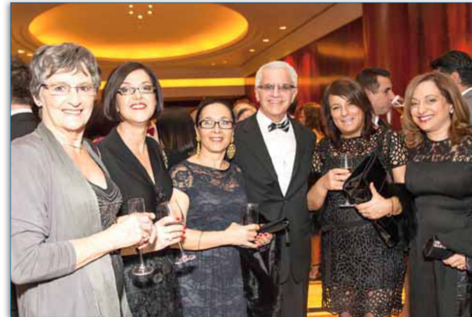
Dignitaries, special guests, members of the GOCMV Board, parent, teachers and students celebrated together Alphington Grammar's 25 years

Independent schools in Australia 25 years is relatively young yet, Alphington Grammar School is a school with a big heart and strong vision going forward". The strength of the school community was demonstrated