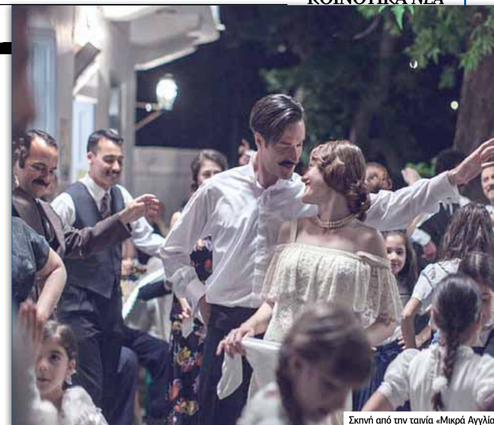
Σκηνή από την ταινία «Μικρά Αγγλία»

Ο Βούλγαρης με διεισδυτική και στοχαστική ματιά αφηγείται κινηματογραφικά μία ιστορία, που φωτίζει τις σκιές της καθημερινότητας, τα κρυμμένα μυστικά, τις ταραγμένες σχέσεις και το κόστος της υποταγής.